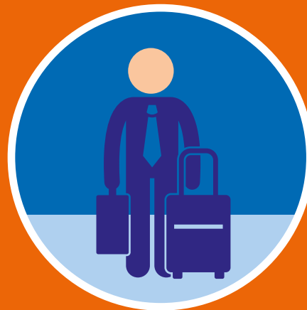
Muut kuin EU-kansalaiset